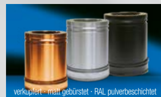
Lieferbare Oberflächenvarianten (Aufpreispflichtig)

Alle notwendigen Teile für einen kompletten Schornstein (Bodenmontage) sind im Lieferumfang enthalten. Bei höheren Schornsteinen einfach mit den entsprechenden Rohrlängen und Wandbefestigungen ergänzen, Zubehörbauteile - siehe Rückseite.