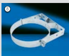
Wandbefestigung WB50, WBV