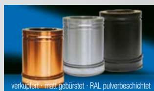
Lieferbare Oberflächenvarianten (Aufpreispflichtig)

Alle notwendigen Teile für einen kompletten Schornstein (Bodenmontage) sind im Lieferumfang enthalten. Bei höheren Schornsteinen einfach mit den entsprechenden Rohrlängen und Wandbefestigungen ergänzen, Zubehörbauteile - siehe Rückseite.