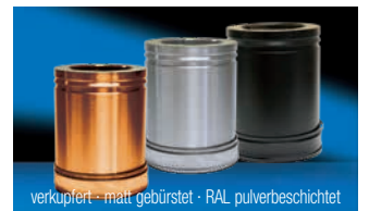
Lieferbare Oberflächenvarianten (Aufpreispflichtig)

Alle notwendigen Teile für einen kompletten Schornstein (Bodenmontage) sind im Lieferumfang enthalten. Bei höheren Schornsteinen einfach mit den entsprechenden Rohrlängen und Wandbefestigungen ergänzen, Zubehörbauteile - siehe Rückseite.