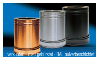
Lieferbare Oberflächenvarianten (Aufpreispflichtig)

Alle notwendigen Teile für einen kompletten Schornstein (Bodenmontage) sind im Lieferumfang enthalten. Bei höheren Schornsteinen einfach mit den entsprechenden Rohrlängen und Wandbefestigungen ergänzen, Zubehörbauteile - siehe Rückseite.