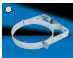
Wandbefestigung WB50, WBV