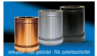
Lieferbare Oberflächenvarianten (Aufpreispflichtig)

Alle notwendigen Teile für einen kompletten Schornstein (Bodenmontage) sind im Lieferumfang enthalten. Bei höheren Schornsteinen einfach mit den entsprechenden Rohrlängen und Wandbefestigungen ergänzen, Zubehörbauteile - siehe Rückseite.