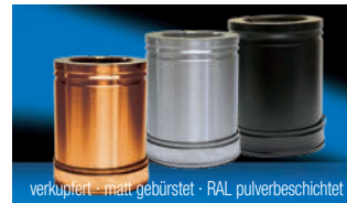
Lieferbare Oberflächenvarianten (Aufpreispflichtig)

Alle notwendigen Teile für einen kompletten Schornstein (Bodenmontage) sind im Lieferumfang enthalten. Bei höheren Schornsteinen einfach mit den entsprechenden Rohrlängen und Wandbefestigungen ergänzen, Zubehörbauteile - siehe Rückseite.